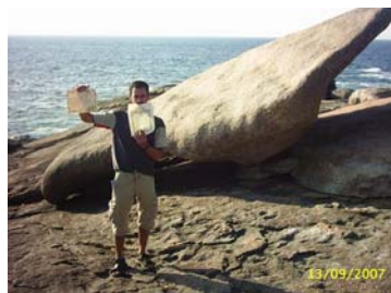
PEDRA 2 CADRIS