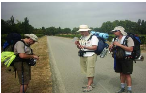
Peregrinos de Mataró, mis compis.

PD: En la comida y la cena del restaurante de la plaza (algo de cultura), la camarera era una chica muy guapaaaaa y amable.